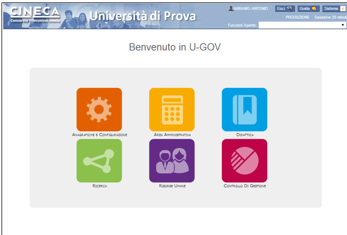
Figura 1 - La nuova pagina di ingresso