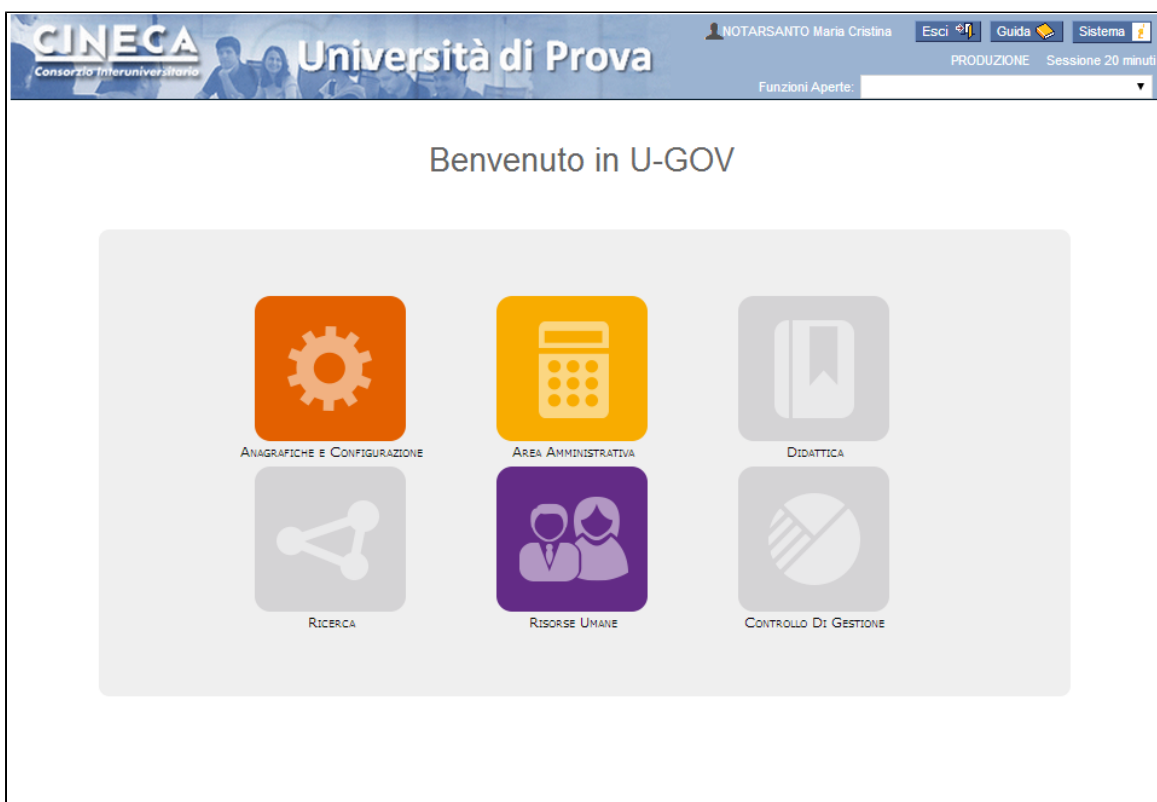
Figura 2 - Aree non accessibili per mancanza dei corrispondenti diritti