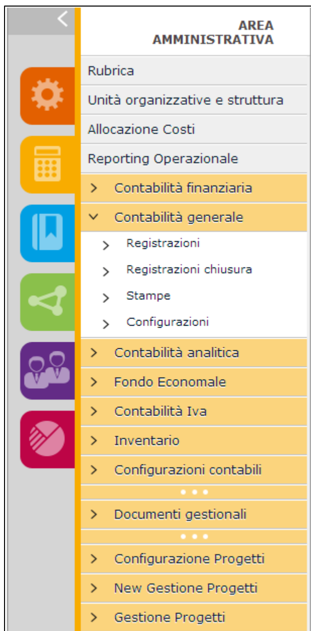
Figura 3 - Il nuovo menu applicativo

Tutti gli URL diretti sono ovviamente sottoposti a controllo di accesso, ma (come avviene già oggi) una volta che l'utente avrà acceduto ad una qualsiasi delle applicazioni, non sarà necessario per lui re-inserire le credenziali per accedere ad una applicazione diversa ( Single Sign On tra le applicazioni).